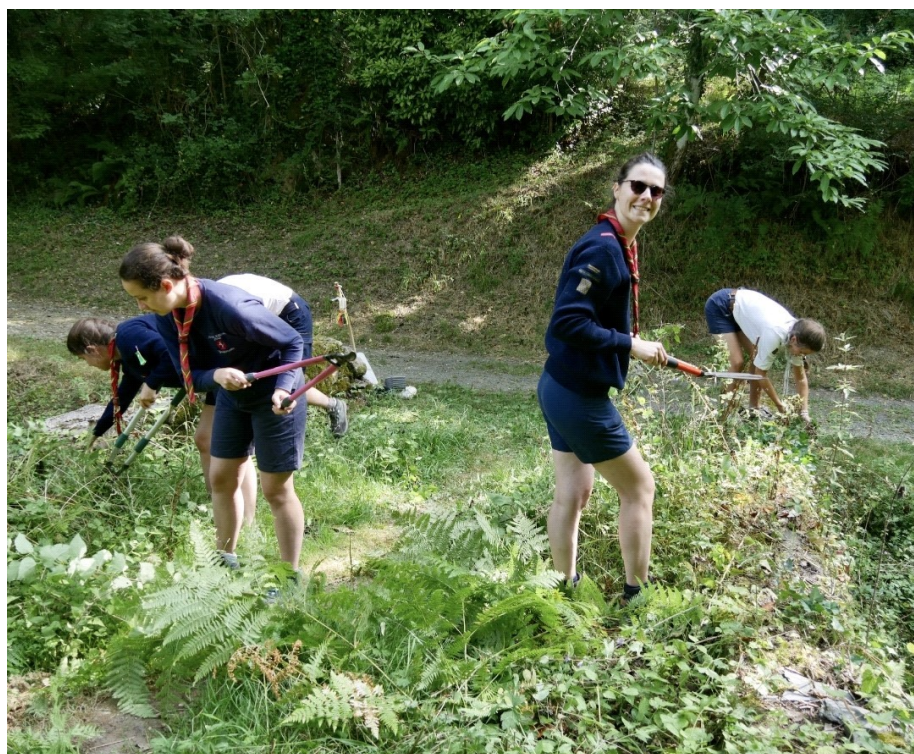
Les guides-ainées à l'œuvre au vieux cimetière du Saillant