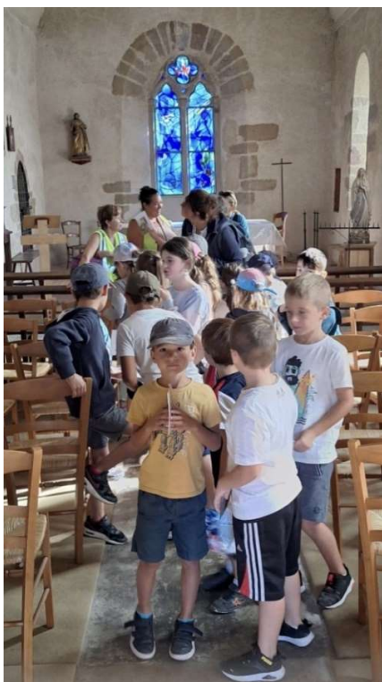
Les enfants devant le vitrail du chevet

Le dimanche 17, entre 14h30 et 17h30, l'église fut visitée par une vingtaine de personnes. Une vidéo, préparée par D. Brancart récapitulait, l'essentiel des travaux depuis l'incendie alors que F. Géraudie donnait des indications sur les différents éléments du mobilier et des objets liturgiques. Tous les visiteurs apprécièrent la grande qualité de la rénovation de l'édifice.