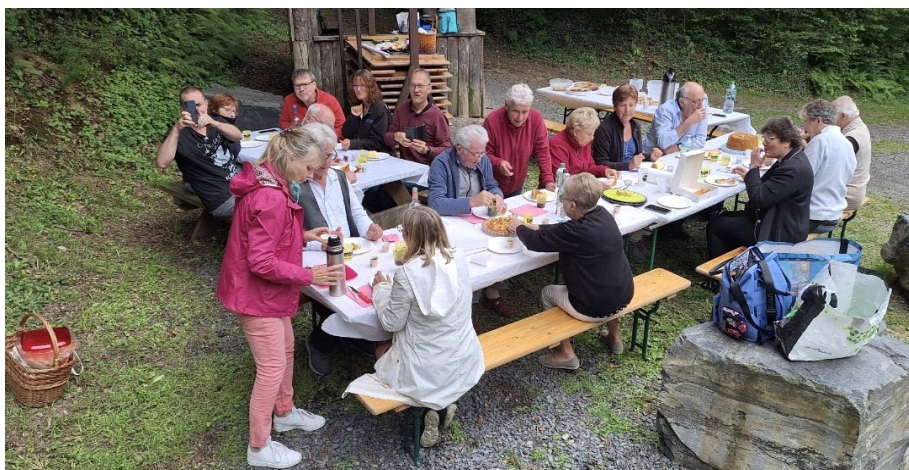
Les convives en pleine dégustation