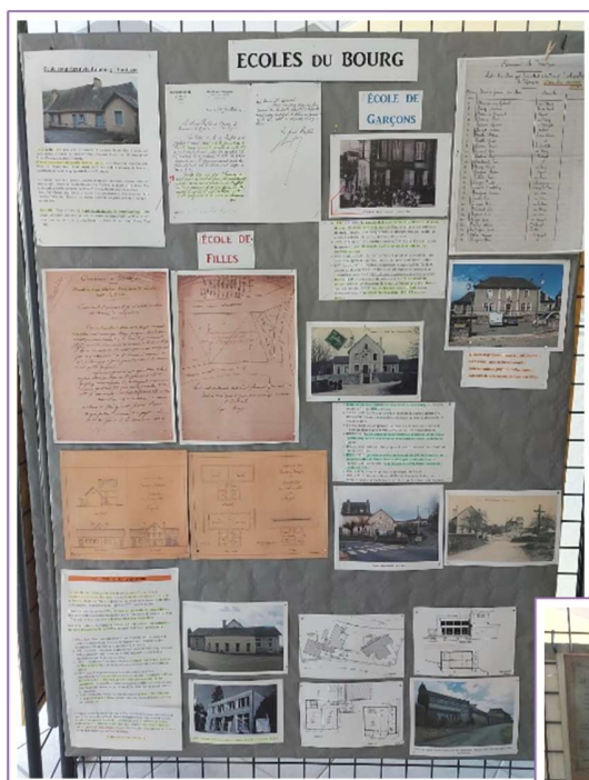
L'école du Bourg