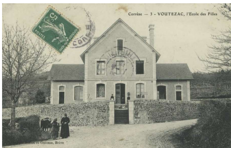
L'école des filles autrefois