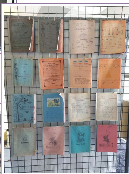
Cahier de classe