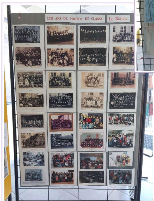
Photo de classe